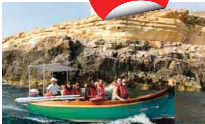
Наш богатый выбор развлекательных мероприятий станет прекрасным дополнением к светящему круглый год солнцу, обеспечив вам успех в обучении и незабываемые воспоминания.