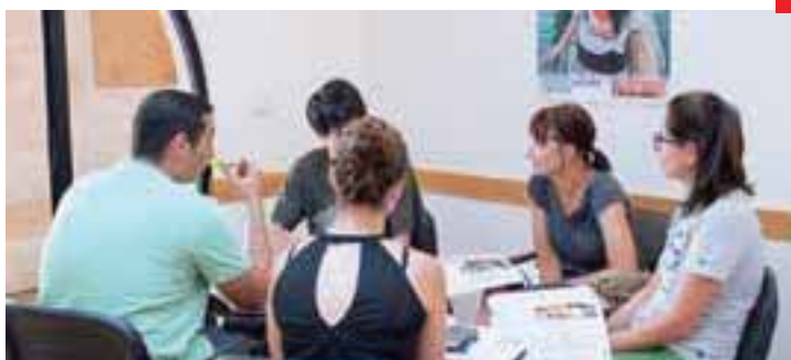
Прекрасно оборудованные учебные классы располагают к эффективному обучению.