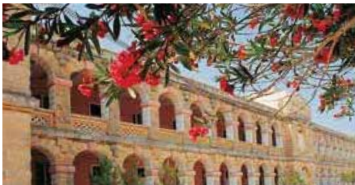
Наша резиденция находится в старинном здании, построенном в средиземноморском стиле, который создает неповторимую атмосферу.